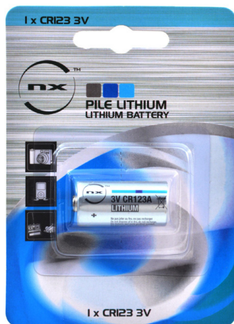
BLISTER DE 1 PC