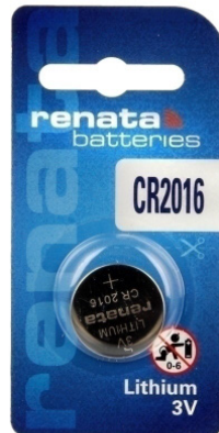
BLISTER DE 1 PC