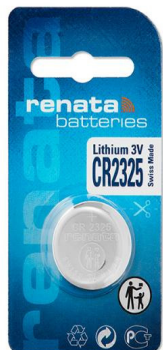
BLISTER DE 1 PC