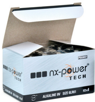
BOÎTES DE 10 PCS